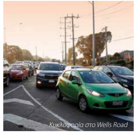
Κυκλοφορία στο Wells Road